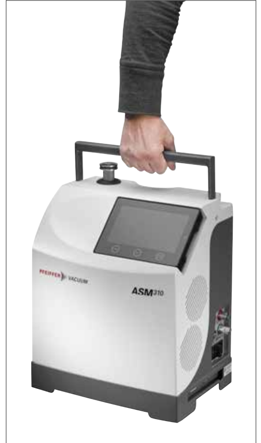
핸들을 안으로 집어 넣을 수 있어 휴대성이 우수함