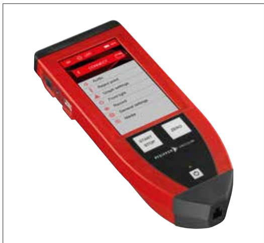
원격 제어 RC10