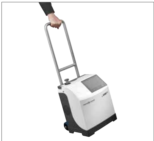
트롤리 위의 ASM 310