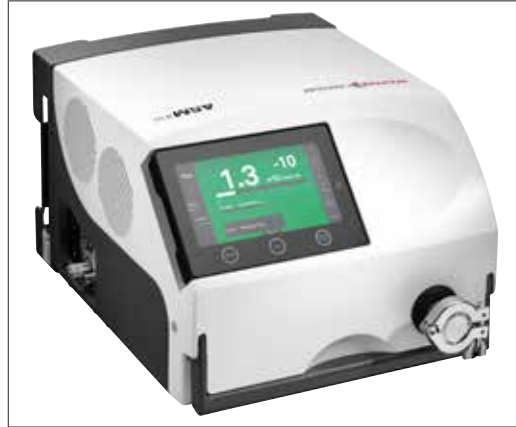
어느 위치에서도 조작 가능