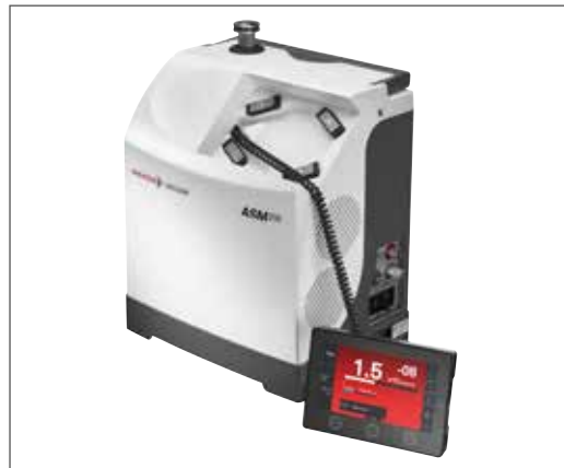
분리형 제어 패널(약 2 m 케이블 포함)